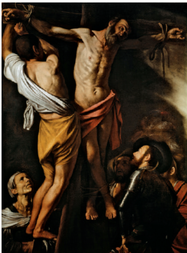
The Martyrdom of St Andrew