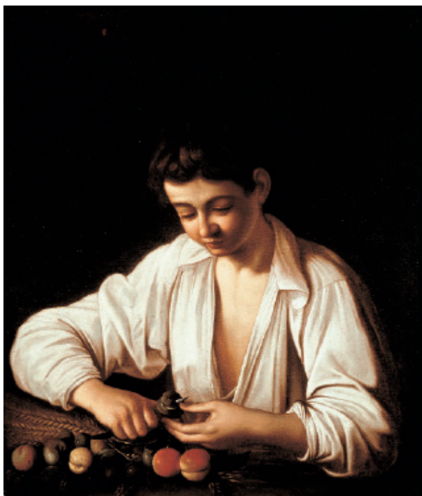
Boy Peeling Fruit