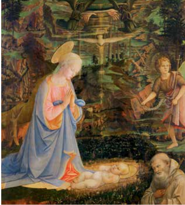
Fra Filippo Lippi (1406/07–69) Adoration of the Child (Camaldoli) Adoração do Menino (Camaldoli) Adoracja Dzieciątka (Camaldoli) Adorace dítěte se sv. Janem Křtitelem a sv. Romualdem Adorarea Pruncului cu Sfântul Ioan Botezătorul și Sfântul Romuald (Camaldoli) Το Προσκύνημα του Βρέφους (Camaldoli) 1463, Tempera on panel/Têmpera sobre madeira/tempera na desce/tempera na dřevě/tempera pe lemn/τέμπερα σε ξύλο, 140 × 130 cm, Galleria degli Uffizi, Firenze

life, and during which time his studio had long since become one of the most prominent in the city. He had worked for the most important families, as well as for the Pope and, with his extraordinary talent, his sense of beauty and his universally praised intellect, he had asserted his place as one of the foremost artists of the Quattrocento.