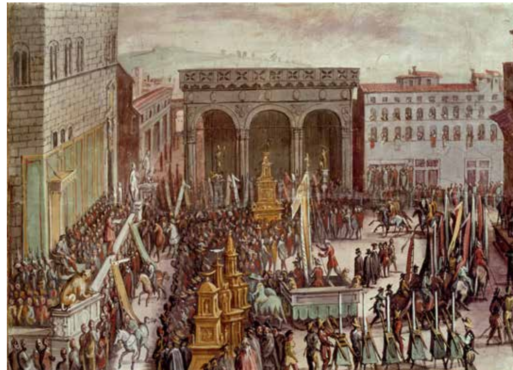
Giorgio Vasari (school/escola/szkoła/škola/școala/σχολή) Procession on Piazza della Signoria, Florence Procissão de velas na Piazza della Signoria, Florença Procesja na Piazza della Signora, Florencja Procesí na Piazza della Signoria, Florencie Procesiune în Piazza della Signoria, Florența Πομπή στην Piazza della Signoria, Φλωρεντία c. 1540, Fresco/Fresco/fresk/freska/frescă/ωμογραφία, Palazzo Vecchio, Firenze