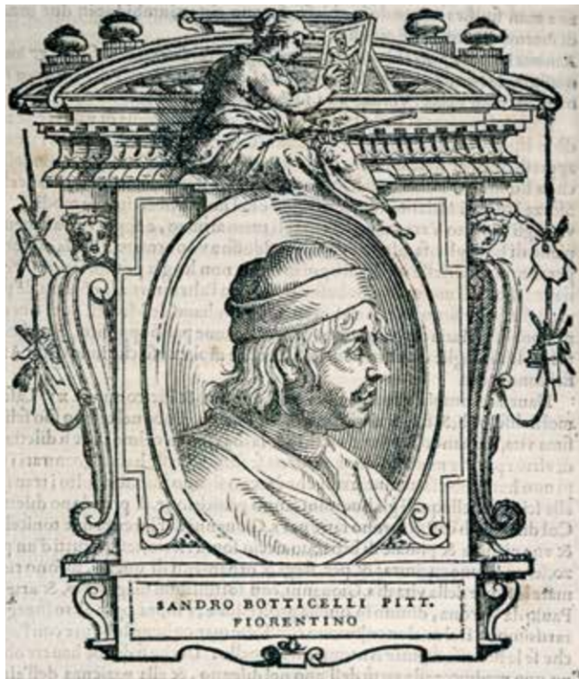
Cristofano Coriolano (?) Vasari (1511-74) Portrait of Sandro Botticelli, from Giorgio Vasari's Lives of the Artists, Florence Retrato de Sandro Botticelli, por Giorgio Vasari, retirado de Vidas dos maiores pintores, escultores e arquitetos, Florença Portret Sandra Botticellego, z Giorgio Vasariego Żywotów najświetniejszych malarzy, rzeźbiarzy i architektów Portrét Sandra Botticelliho z knihy Giorgio Vasariho Životy nejvýznačnějších malířů, sochařů a architektů Portretul lui Sandro Botticelli, extras din Viețile celor mai iluștri pictori, sculptori și arhitecți de Giorgio Vasari, Florența Πορτρέτο του Σάντρο Μποτιτσέλι, από το έργο Οι βίοι των πλέον εξαιρετων ζωγράφων, γλυπτών και αρχιτεκτόνων του Βαζάρι, Φλωρεντία c. 1550-68, Copperplate engraving/Gravura sobre cobre/miedzioryt/mědirytina/gravurã pe cupru/χαλκογραφία, 23,1 × 16,7 cm, Private collection