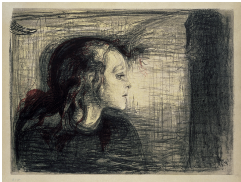
The Sick Girl