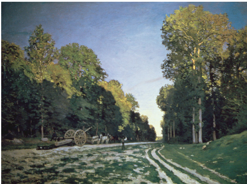
Route de Chailly, Fontainebleau Cesta z Chailly do Fontainebleau Cesta do Chailly vo Fontainebleau Droga z Chailly do Fontainebleau Drumul de la Chailly la Fontainebleau Ο δρόμος προς το Σαγί, Φονταίνεμπλώ

1864, Oil on canvas/olej na plátně/olej na plátne/olej na plótnie/ulei pe pânză/ládi se moussamá, 98 × 129 cm, private collection