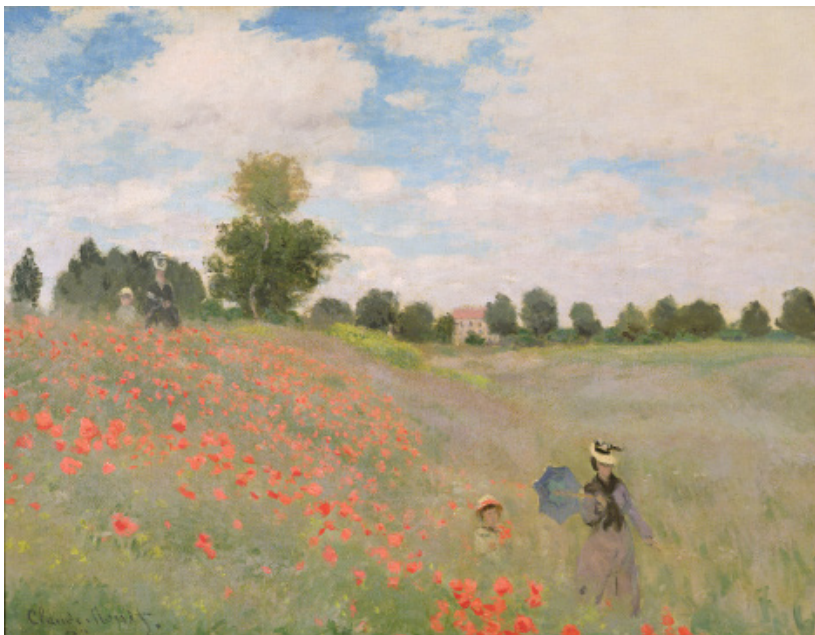
Wild Poppies, near Argenteuil